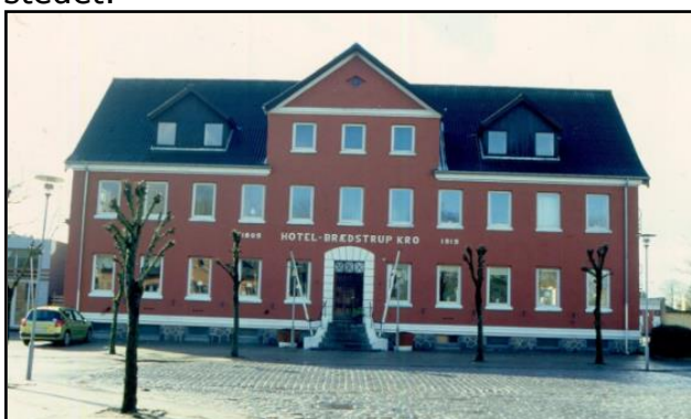
Billede af Brædstrup Kro, 2009.

Vi starter en lille gåtur i Brædstrup fra stedet, hvor Brædstrup Kro lå fra 1809 og indtil for få år siden. I 2019 blev kroen nedrevet og forvandlet til Krohaven. Fra Krohaven spadserer vi rundt i Brædstrup i en lille times tid, hvor vores guide ved udvalgte interessepunkter fortæller om stedet.